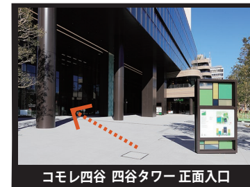
コモレ四谷 四谷タワー 正面入口