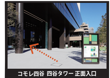
コモレ四谷 四谷タワー 正面入口