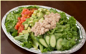
ツナアボカドサラダ