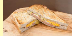
グリルドハムエッグ