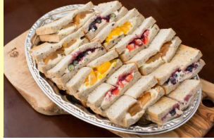
4種のスイーツ サンドイッチプレート