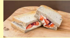
ストロベリーフルーツ