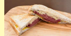
グリルドルーベン