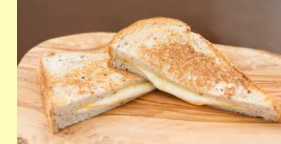
4種のチーズメルト