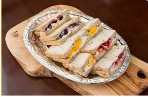
3種のスイーツ サンドイッチプレート