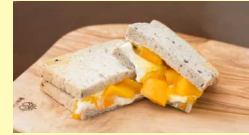
マンゴーフルーツ