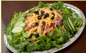
キノーズスペシャルサラダ

サラミ、マッシュルーム、 チーズ、ナッツ、 トマト、オリーブ、 キュウリ、レタス