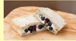
ブルーベリーフルーツ