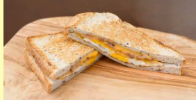
グリルドベーコンエッグ