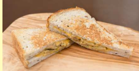
グリルドチーズマッシュルーム